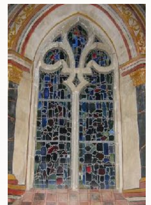
Fenêtre avec fleur de lys