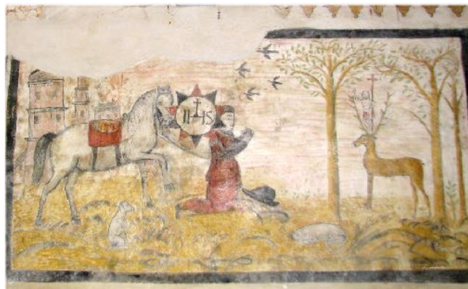
Légende de St Hubert (XVIe)

Une statue du dieu Mercure a été découverte près de la chapelle. Un fanum, petit temple gallo-romain, s'élevait ici. Il a été remplacé par une chapelle dédiée à St Clément Mercure, le dieu des voyageurs, est ici accompagné d'un coq et d'une tortue